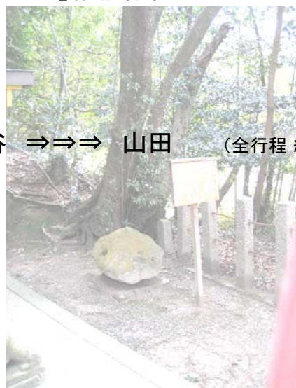
行程：柘榴 ⇒⇒⇒ 乾谷 ⇒⇒⇒ 山田 (全行程 約4km)