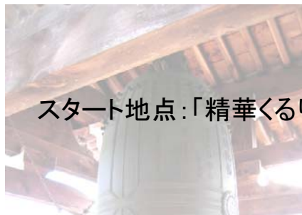
スタート地点：「精華くるりんバス」柘榴停留所