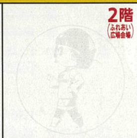
2階 (ふれあい広場会場)