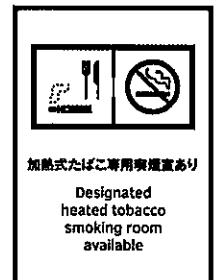
加熱式たばこ専用喫煙室あり