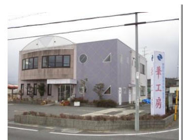
精華町地域資源総合管理センター華工房

「洛いも」は、夏はかわいいハート形の葉の「緑のカーテン」としても活躍し、環境にも優しい作物です。