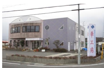
精華町地域資源総合管理センター華工房

「精華町地域資源総合管理センター華工房」では、精華町内で生産された農作物をより付加価値の高い加工品として、消費者のニーズに応えるための研究開発を行い、地産地消を進めています。