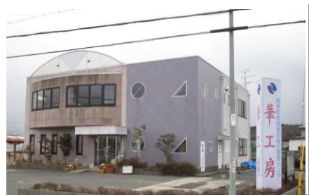
精華町地域資源総合管理センター華工房

「精華町地域資源総合管理センター華工房」では、精華町内で生産された農作物をより付加価値の高い加工品として、消費者のニーズに応えるための研究開発を行い、地産地消を進めています。