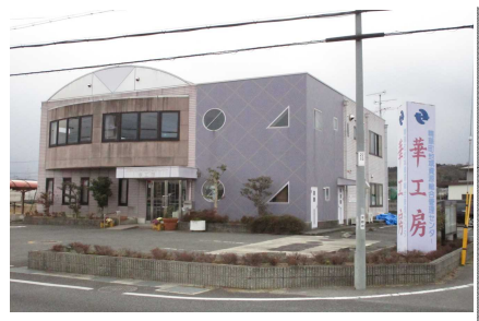
精華町地域資源総合管理センター華工房

「精華町地域資源総合管理センター華工房」では、精華町内で生産された農作物をより付加価値の高い加工品として、消費者のニーズに応えるための研究開発を行い、地産地消を進めています。