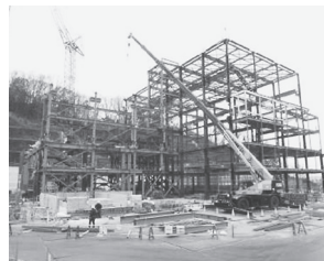
施設鉄筋建方工事 (平成 29 年3月)