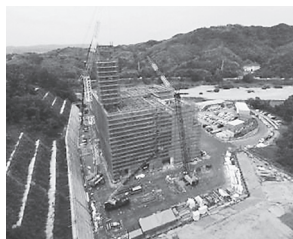
プラント据付工事 (平成 29 年9月)