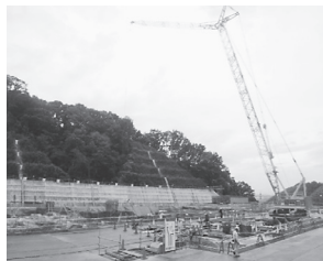
ごみピット掘削工事 (平成 28 年9月)