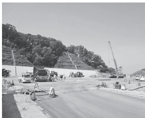
工事着工 (平成 28 年5月)