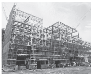
鉄骨建方工事・ プラント据付工事 (平成 29 年6月)