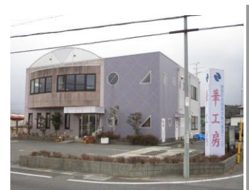
精華町地域資源総合管理センター華工房

「洛いも」は、夏はかわいいハート形の葉の「緑のカーテン」としても活躍し、環境にも優しい作物です。