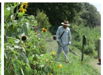
機械、カマによってどんどん刈られていく草！ 機械は燃料・人は水分を補給しながら作業です。