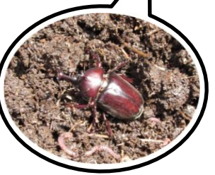
たくさんの生き物が集まりました。