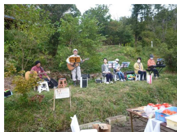
素敵な演奏を披露してくださった ながたんバンドの皆さんです