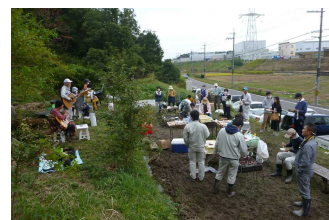
とても楽しい一日になりました