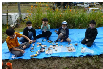
みんなで木工体験