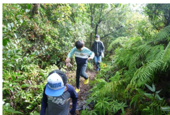
子ども達は山の散策へ