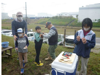
手作りの名札を作ります