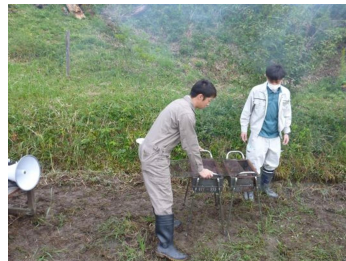
こちらでは網の準備を