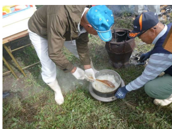
とてもきれいに炊き上がりました