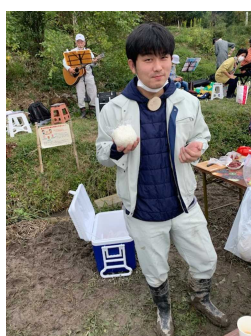
おいしい新米おにぎり