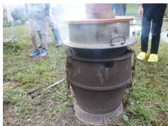
新米を釜で炊き上げます