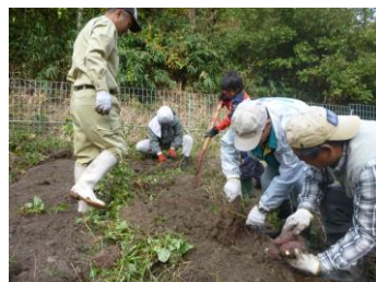
さつまいもの収穫