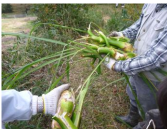
マコモダケの収穫