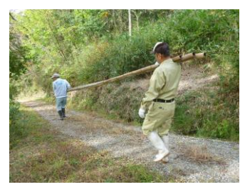
竹を山から切り出して⇒