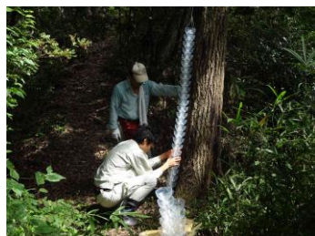
捕獲トラップ設置中