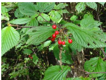
ソヨゴの真っ赤な実