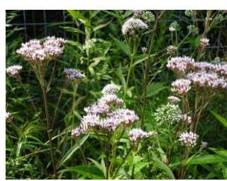
畑に咲くムラサキヒヨドリバナ