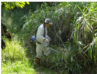
大きく育った草を草刈り