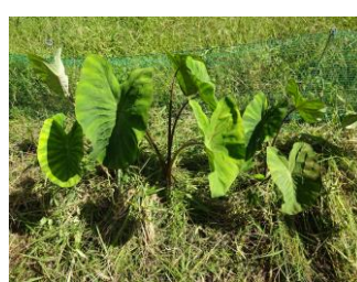
草から姿を表したサトイモ