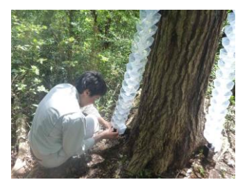
1本の木に3列設置します