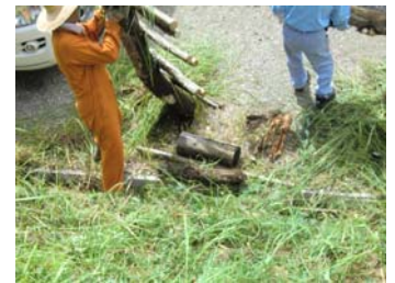
完成は次回になります