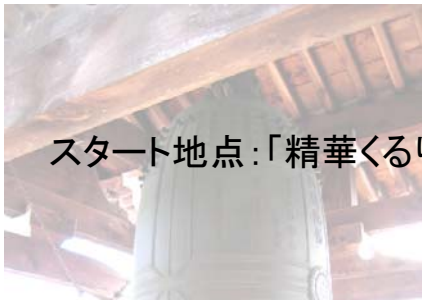
スタート地点：「精華くるりんバス」柘榴停留所