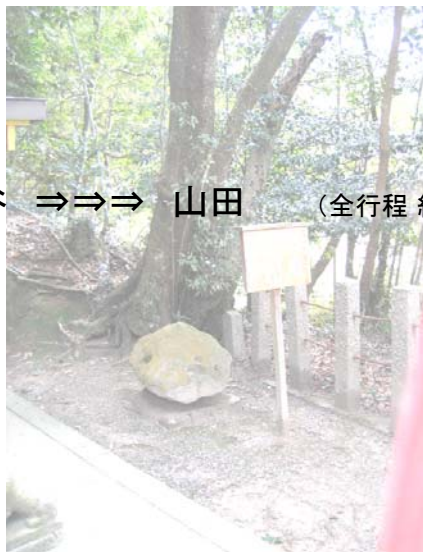
行程：柘榴 ⇒⇒⇒ 乾谷 ⇒⇒⇒ 山田 (全行程 約4km)