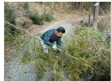
見事に切れました。流石！