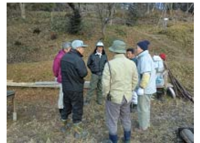
こちらは世話人メンバー。 開始前の準備が大事です。