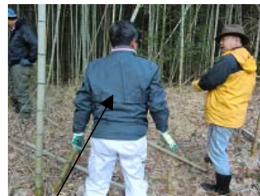
名人による竹切り講座開催中