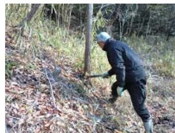
階段用の木を伐採中……