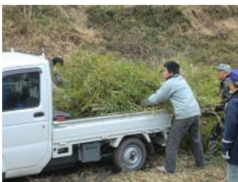
鳥谷公園で伐採した竹を軽トラから下ろす作業