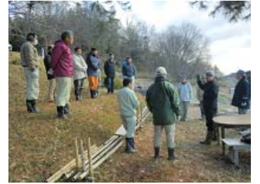
作業開始前に皆でミーティング