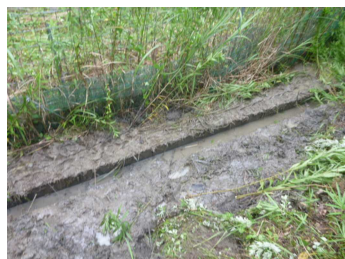
水が流れるようになりました