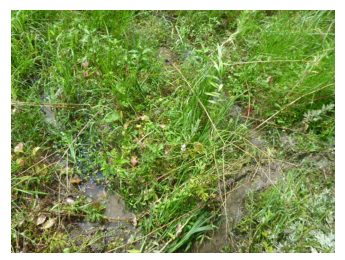
畑の中にはうねの痕跡が！