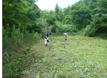
きれいに刈れました