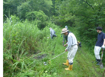
草と土の下から・・・