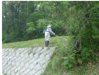
斜面の草も刈って行きます。