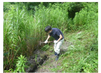
水路が出てきました