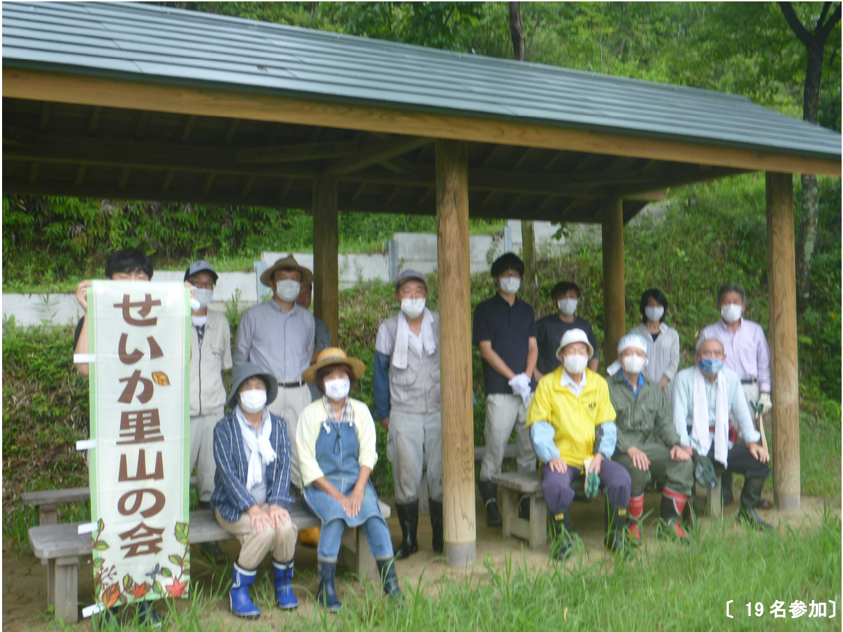
〔 19名参加 〕

今月の定例活動は、始めは曇り空でしたが、途中からは良く晴れ、とても暑い中での活動となりました。先月に引き続き里山の下草狩りや水路の清掃を行ったほか、子どもたちは里山の池でザリガニ釣りを楽しんでくれました。