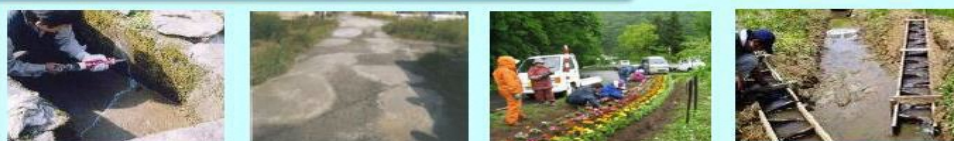
水路のひび割れ補修 農道の窪みの補修 植栽活動 水田魚道の設置