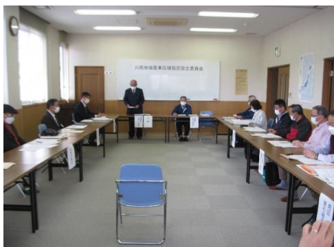
2022(令和4)年3月30日 「川西地域農業広域協定」設立委員会の開催