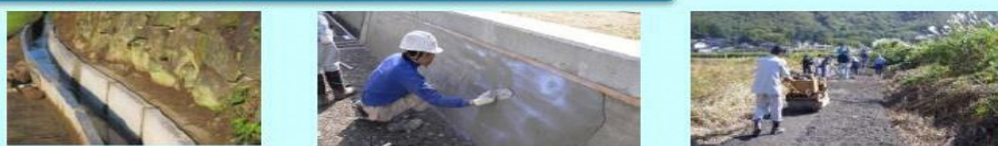
素掘り水路からコンクリート水路への更新 老朽化した水路壁のコーティング 未舗装の農道をアスファルトで舗装