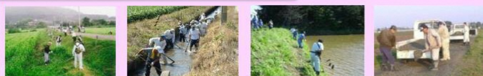
農地法面の草刈り 水路の泥上げ ため池の草刈り 農道の路面維持