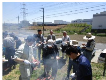
みんなでおいしく交流