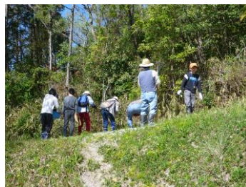
山菜探し始まりました