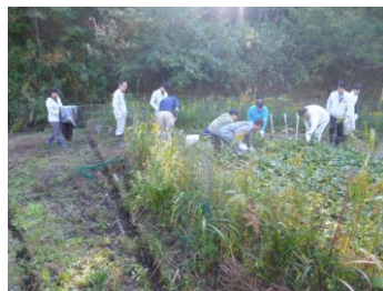
まず草を刈ります