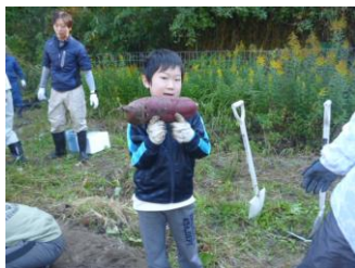
さつまいも掘れたよ～