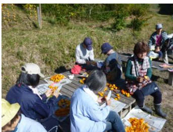
柿の選定と皮むき