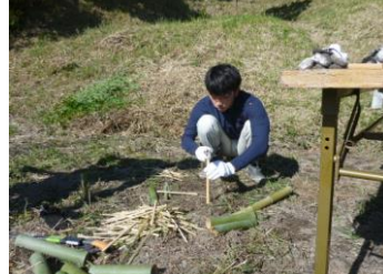
竹を細かく割ります