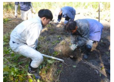
洛いも掘れました