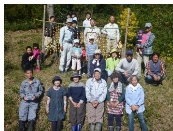
完成した干し柿の前で、ハイポーズ