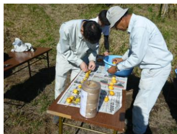
皮をむいた柿をひもに通します