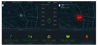
統合管理(街灯・カメラ・サイネージ)