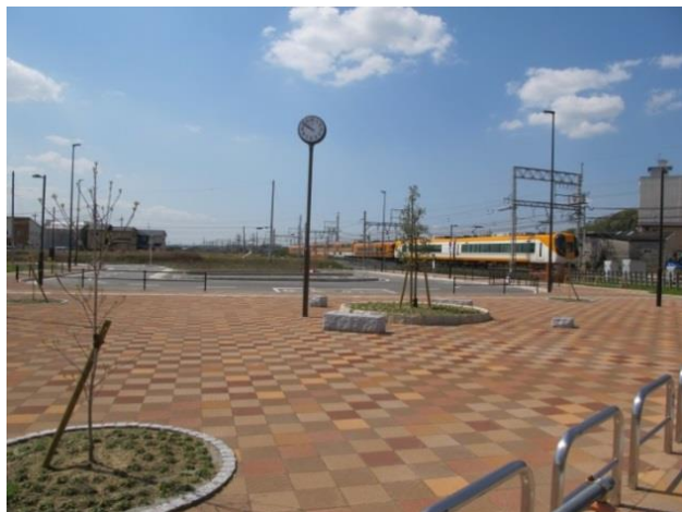
<駅前広場北側の1号公園>