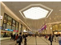
阪急観光センター