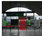
新祝園駅・けいはんなプラザ