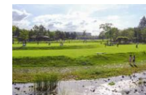
けいはんな記念公園