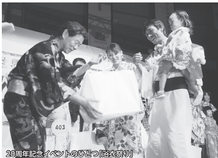
20周年記念イベントのひとつ「浴衣祭り」