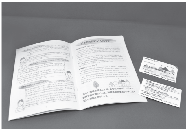
町のDV防止啓発冊子と携帯用啓発カード

近年、ドメスティック・バイオレンス（DV）についての認知度は高まっています。しかし、被害を受けた人の約半数がどこにも相談しなかったという国の報告【注】があります。DVを知っているも、いざ自分の身に起きると、まだまだ相談しづらい現状があるようです。 日本は長い歴史のなかで「我慢すること」を美德とする傾向がありました。また、自分の置かれている現状や目の前の問題に対して「仕方がない」と、飲み込んでしまいう性質もありません。