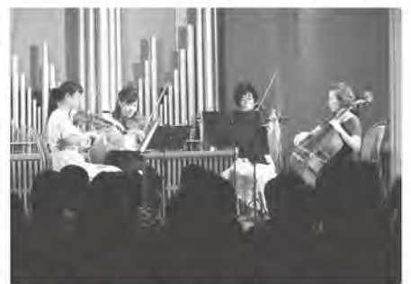
アニメ音楽も弦楽四重奏で演奏