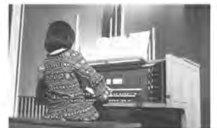
重厚なパイプオルガンの独奏

今回はけいはんなフィルハーモニー管弦楽団を奏者に迎え、パイプオルガンと管楽器・弦楽器のアンサンブルで、スタジオジブリやディズニーの映画音楽をはじめ、ポップからクラシックまで親しみ深い曲などが演奏され、会場は大いに盛り上がりました。