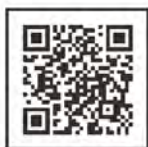
せいか 365 健康 ポイント事業

ポイント事業や協賛店などの詳細は近日 チラシを各戸配布、または町ホームページ でご確認ください。次の二次元コードから 町ホームページのせいか365健康ポイント のページを閲覧できます。