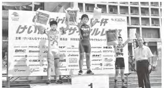
表彰式で記念撮影