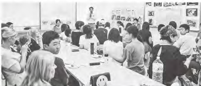
青年海外協力隊の体験談