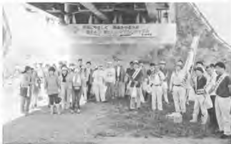
クリーン・リサイクル運動重点清掃の参加者

また、飲み物を配る際には、再利用可能なプラスチック製のリユースコップを使用し、紙コップやペットボトルなどのごみの発生抑制を図るとともに、参加者に対し、「食品ロスの削減」、「生ごみの水切り」、「そのほかのリサイクルできる紙の分別徹底」を通じたごみ減量化の啓発に取り組みました。