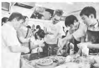
みんなで料理を作ろう

作って食べ、話を聞き、考えるなど、さまざまな方向から世界のことを考える良い機会となりました。