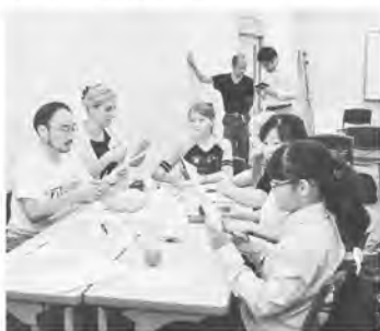
地図を使ってワークショップ