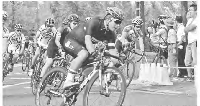
白熱のレース展開