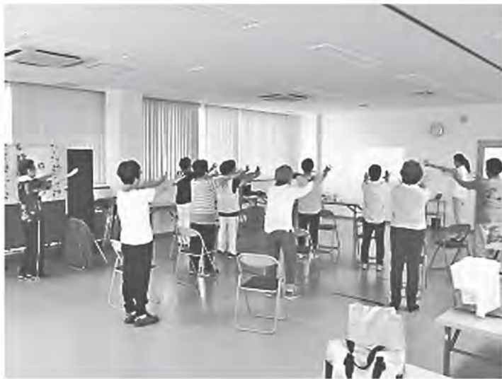
関せいか365事務局(健康推進課・福祉課・国保医療課・生涯学習課・企画調整課)☎95-1905(健康推進課内)