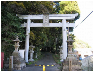
しんでんじんじや とりい 神殿神社の鳥居