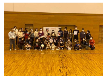
ことし 今年の10月に開催した 第1回SGN スポーツの日の様子