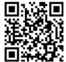
ながら防災訓練レポート