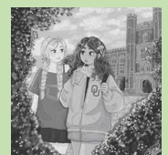
ノーマン市在住アーティストのart作品(一部)