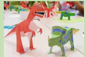
ワークショップのイメージ