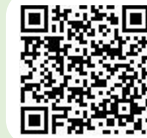
問危機管理室危機管理係 TEL:95-1928