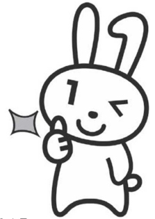
問総合窓口課戸籍住民係 TEL:95-1915

町内もお住まいのマイナンバーカード新規申請をご希望の方で、町役場に来庁することが困難な方向けに、職員が自宅に出張訪問し、申請の受け付けをするキャンペーンを再度行います。申請に必要な顔写真も撮影します。訪問可能期間は8月1日(金)~10月31日(金)です(※土日祝除く)。訪問を希望される方は、電話で予約してください。