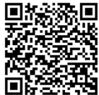
インターネット予約はこちら