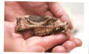
「The Norman Transcript」の写真

サム・ノーブル博物館で、「ジュラシック・ワールド」の新作映画にオクラホマ州の研究者によって発見された化石の恐竜が登場することを祝って、「恐竜の日」のイベントが開催されました。その恐竜の唯一の化石は現在サム・ノーブル博物館で展示されており、来場者は新作映画に登場する可愛らしい恐竜のキャラクターにインスピレーションを与えた本物の化石を見ることができます。イベントでは、撮影スポット、クラブ、恐竜の絵本の読み聞かせ、古生物学者による発表などの恐竜をテーマにした企画が行われました。また、ジュラシック・パークに登場する Jeep という車に乗り、ジュラシック・パークのコスチュームを着て、恐竜の人形を使うパフォーマンスのグループも来場しました。来場者はさまざまな体験を通して、恐竜についてより多くのことを学ぶことができました。新作映画に登場する恐竜は、サム・ノーブル博物館にとって大切な存在です。そのため、このイベントで約30年前の発見を記念したのです。