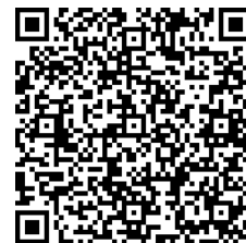
ちょう 町ホームページ

「せいか祭り」は、住民の皆さんの楽しみや誇りとなるイベントとして、地域の活性化や町内外の方々の交流を目的に開催しているお祭りです。楽器演奏やダンスなど、せいか祭りを明るく華やかに彩る「学研ミュージックストリート」を盛り上げていただける方々を募集しますので、ぜひ、積極的に応募してください。