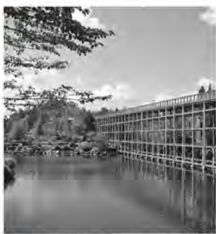
水景園(けいはんな記念公園内)

問い合わせは記念公園管理事務所 /TEL 93-1200・FAX 93-2688