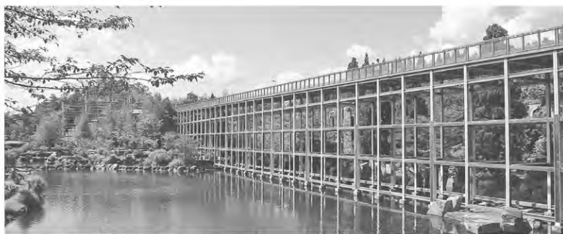
水景園(けいはんな記念公園内)