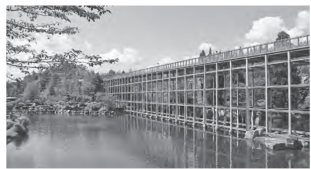
水景園(けいはんな記念公園内)

開園時間 午前9時～午後5時 定休日 12月28日～1月4日 入園料 一般2000円・小中学生1000円 ※ 入園日時点で60歳以上の方は、生年月日が記載された証明書を提示すると無料になります。 ※ 障害者手帳やきょうと子育て応援パスポートの提示、25人以上の団体割引などもあります。 問 けいはんな記念公園管理事務所 / 電話 93-12000・FAX 93-12688