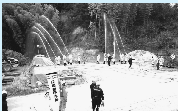
日ごろの訓練が迅速な消火活動につながります

現場に駆けつけた消防団員は、本団の指令のもと、同池からポンプに吸水し、迅速な消火活動を展開しました。