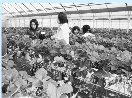
腰よりも少し低い位置に実があるので、かかめず摘めます

今年は、暖冬のおかげでイチゴの育ちは早いそうです。イチゴの甘い香りが町中にあふれるようになると、いよいよ春の到来です。「イチゴの精華」を発信する拠点が2カ所になった今春、よりたくさんの方の来町が期待されます。