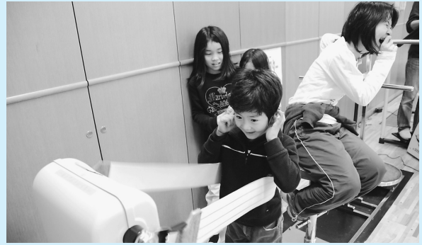
この日はトレーニング室も無料開放