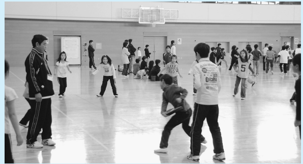
白熱したドッジビー競技大会