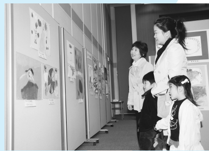
子どもたちの元気あふれる絵がいっぱい

この美術展は、町教育委員会の指針「せいか学びと育ち'08」を積極的に推進するための取り組みで、町内の幼稚園児から中学生までが描いた絵画約160点が展示されました。これだけの作品が一堂に集められると壮観です。それぞれの年代の発育・成長段階における絵画を間近に見ることができ、大変興味深いものとなりました。