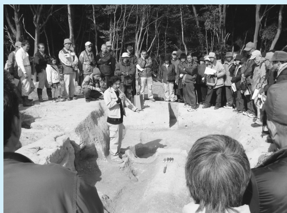
見つかった墓穴の説明を、熱心に聞き入る参加者ら