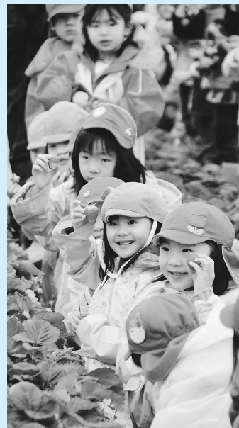
手にとったイチゴは、赤くて、とても甘かったです