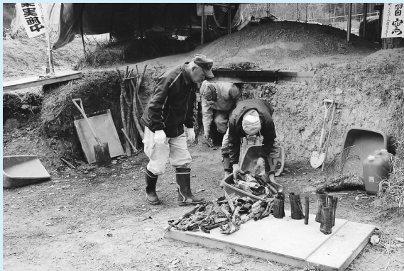
「学習窯」の処女作品

のシルバー人材センターの作業所に作られたもので、今日のこの日を迎えるまで、窯の天井が落ちたり、炭が灰になったりと試行錯誤を重ね、文字通り学習しながら完成に至りました。