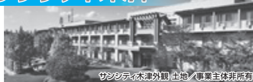
サンシティ木津外観 土地/事業主体非所有