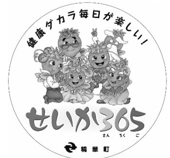
せいか365 シンボルマーク

最後に、精華町のこれからのまちづくりについて、ご意見等ございましたらお聞かせください。