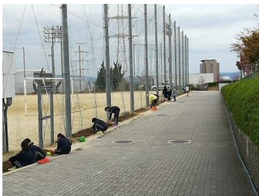
花壇の植え替え(環境整備)

地域住民等の連携・協働により、学校の環境整備や見守り活動を通した安心・安全の確保、子どもたちのための体験活動機会の充実など、具体的な活動が進んできている。