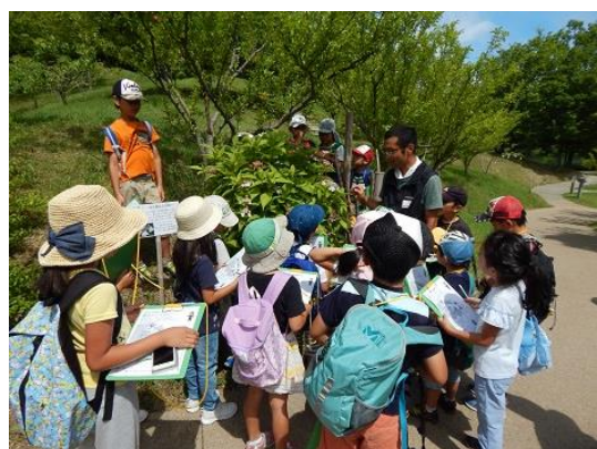
精華まなび体験教室(自然体)