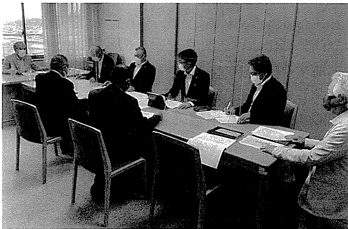
5月13日「町の都市計画」について（町議会）