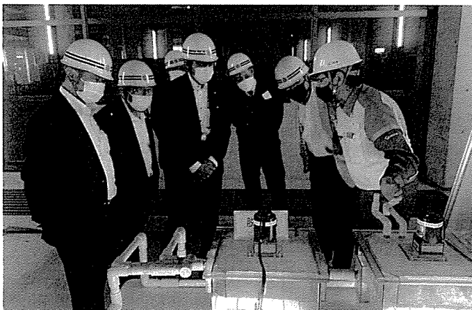
10月18日「木津川広域下水処理場を視察」（木津川上流浄化センター）