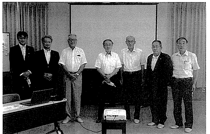
7月16日「児童福祉の状況は？」（大和の家）