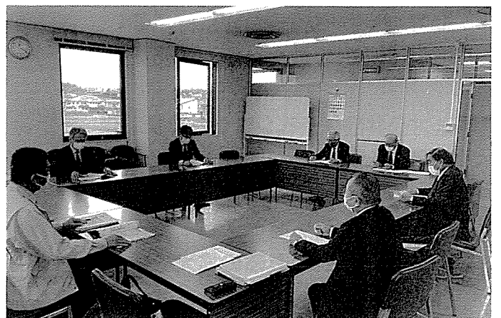
11月14日「上下水道の現状は？」（町上下水道部）