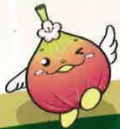
じょうりんちゃん 城陽市