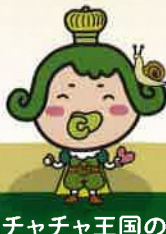
チャチャ王国の おうじやま