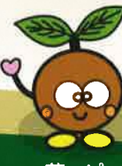
茶ッピー 宇治田原町