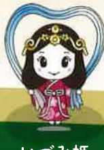
いづみ姫