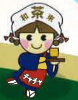
茶茶ちゃん 和束町