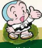
一休さん