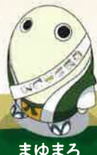
まゆまる 京都府 ©京都府 まゆまる