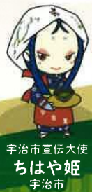
宇治市宣伝大使 ちはや姫 宇治市