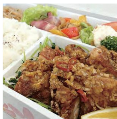
Cafe Rhine (カフェ ライン)