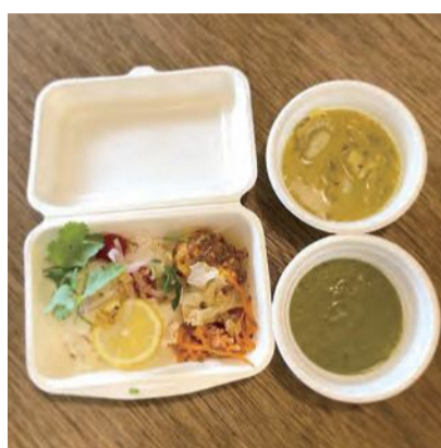
オルタナティブカレー