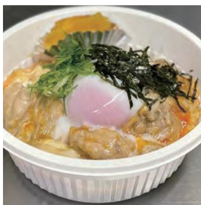
ぬちぐすい鳥鳥 祝園店