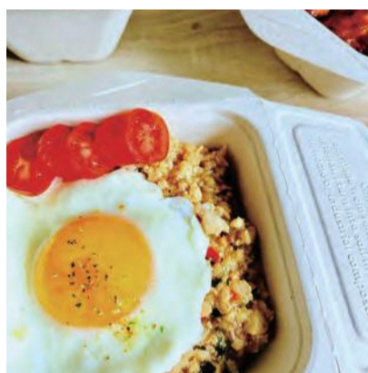
luck Room cafe