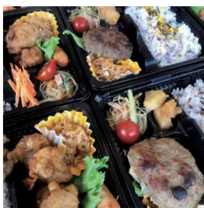
Yell Cafe (え〜る かふえ)