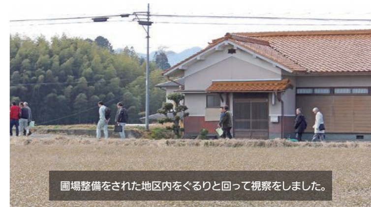
圃場整備をされた地区内をぐるりと回って視察をしました。