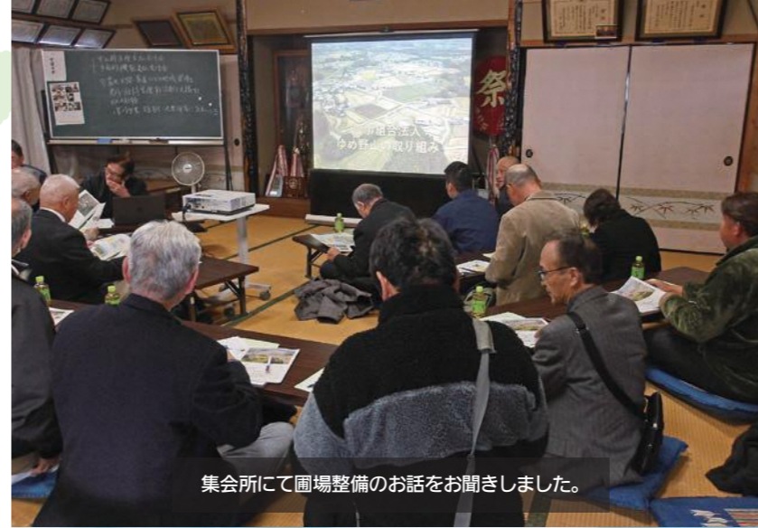
集会所にて圃場整備のお話をお聞きました。