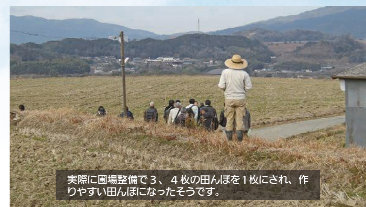
実際に圃場整備で3、4枚の田んぼを1枚にされ、作りやすい田んぼになったそうです。