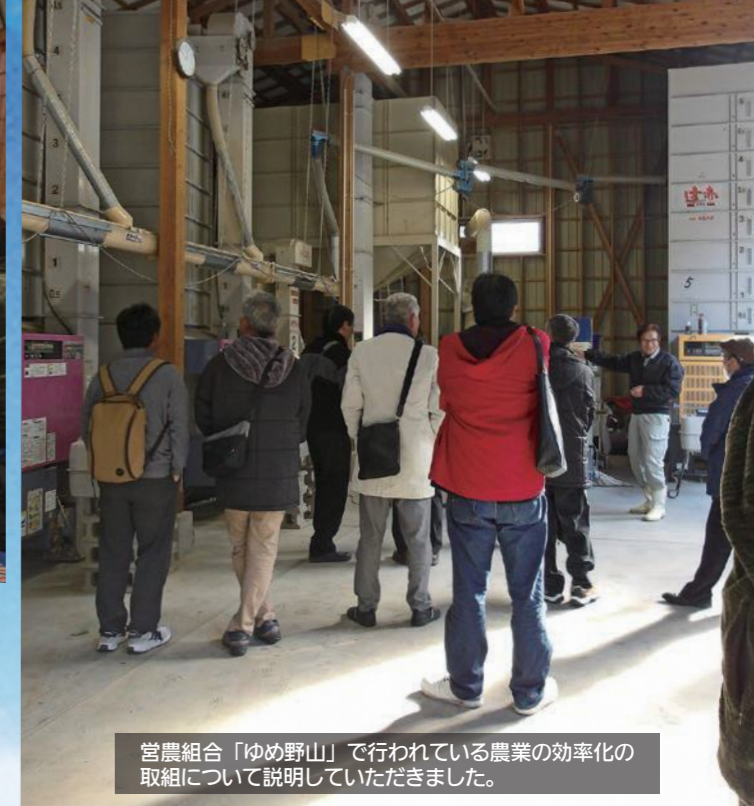
営農組合「ゆめ野山」で行われている農業の効率化の取組について説明していただきました。