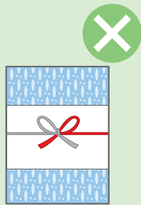
お歳暮・お年賀など