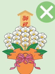
落成式・開店祝などの祝花、葬儀の供花、病気見舞いなど