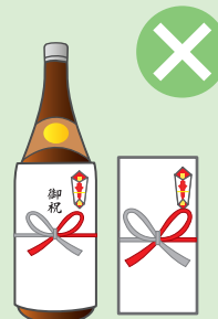
お祭りへの寄附・差し入れ、町内会の集会・旅行などの催物への寸志・飲食物の差し入れ

※政治家本人が結婚披露宴、葬式などに自ら出席してその場で行う場合には、罰則が適用されない場合があります。